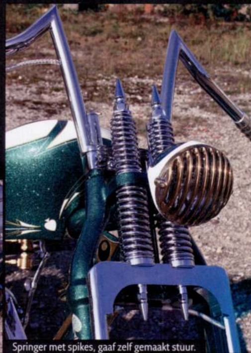
Springer met spikes, gaaf zelf gemaakt stuur.