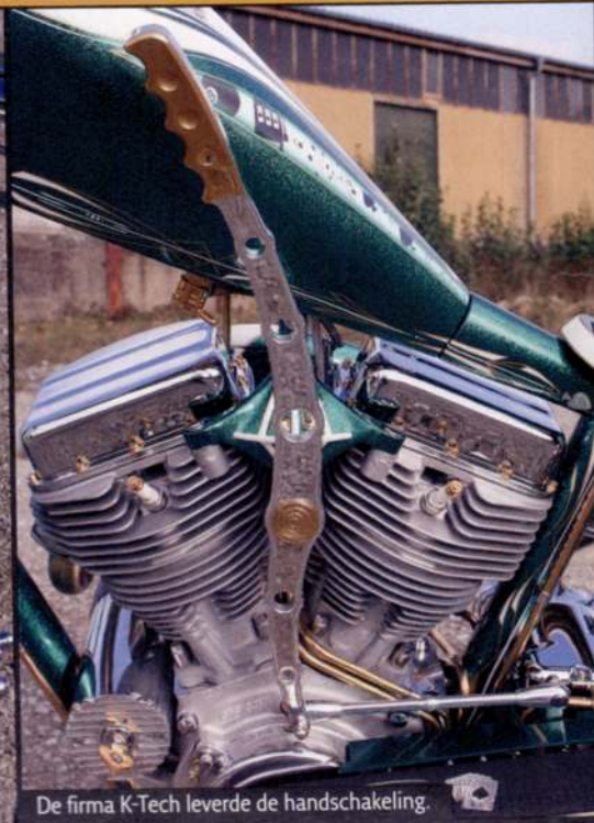
De firma K-Tech leverde de handschakeling.