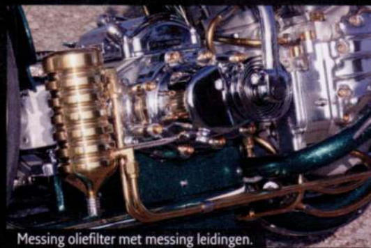
Messing oliefilter met messing leidingen.

het casino het thema van deze bike. Overal zijn symbolen uit het casino in verwerkt, zoals de schoppenaas die bij de achterwiel ophanging en in het balhoofd zijn verwerkt, en de eightball die op de S&S super E carburetor is te vinden. Zelfs op het uiteinde van de sissybar is een schoppenaas gemaakt. Ook het gedetailleerde spuitwerk van AHA design verwijst uiteraard naar dit thema. Gave details zoals het zelfgemaakte messing oliefilter, het vele graveerwerk en de getwiste uitlaten maken deze highneck helemaal uniek.