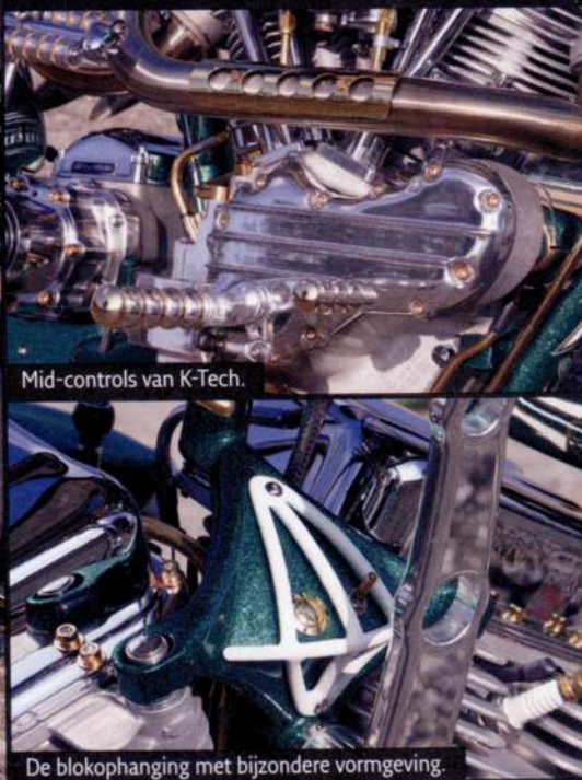
Mid-controls van K-Tech.