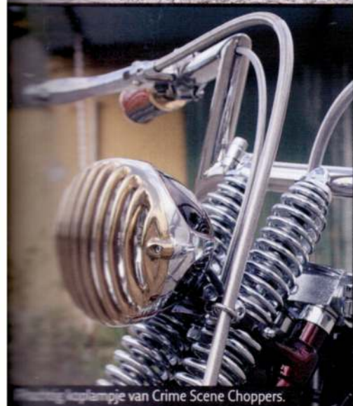
Koplampje van Crime Scene Choppers.