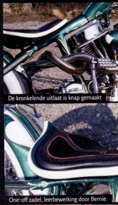
De kronkelende uitlaat is knap gemaakt