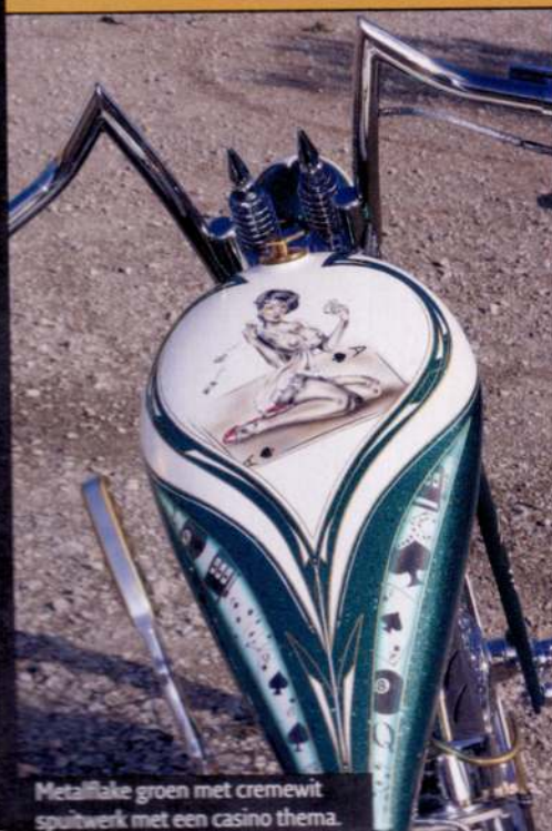
Metallflake groen met cremewit spuitwerk met een casino thema.