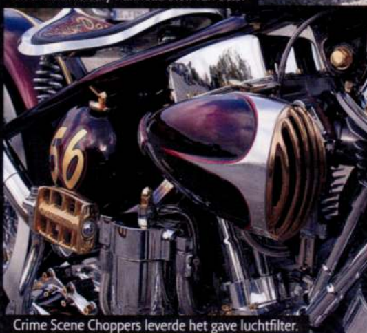
Crime Scene Choppers leverde het gave luchtfilter.