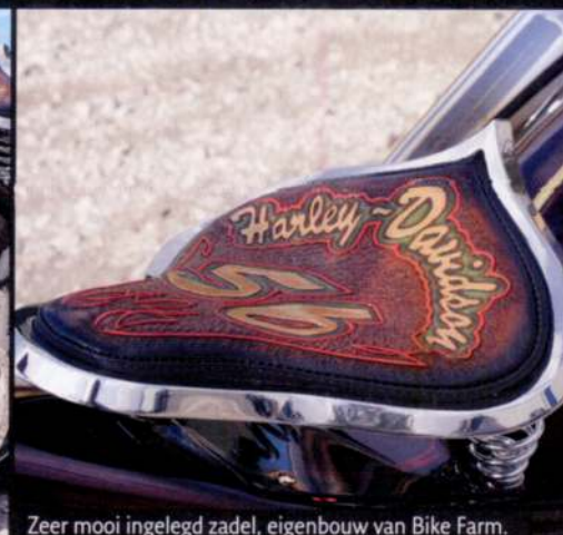
Zeer mooi ingelegd zadel, eigenbouw van Bike Farm.