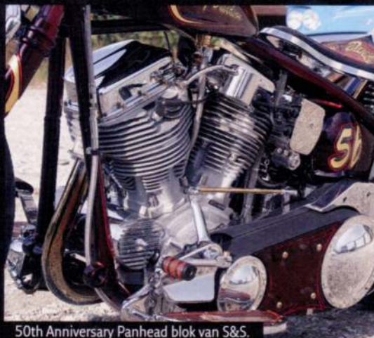
50th Anniversary Panhead blok van S&S.