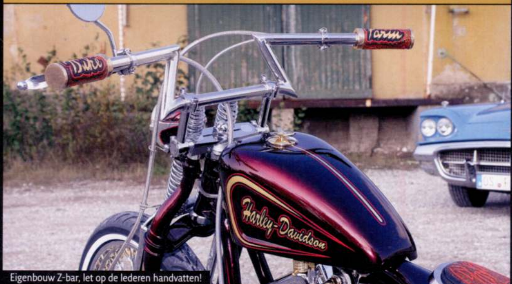
Eigenbouw Z-bar, let op de lederen handvatten!