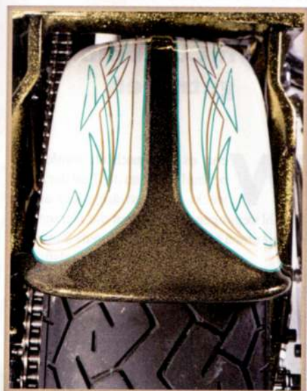
Farbszinierend: Glimmer und Pinstripes von AHA Design