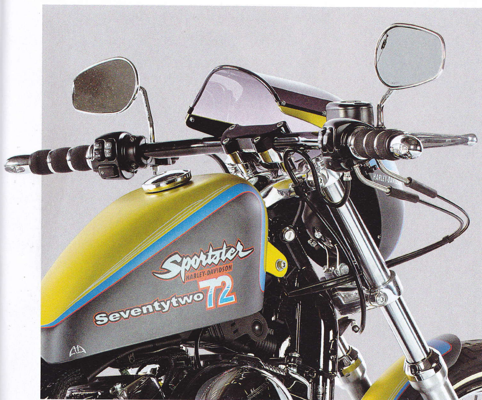
Statt Apehanger eine Fehling-Dragbar und eine Lampenverkleidung. Schon hat die Seventy-Two eine neue Linie. Die Siebziger waren doch eigentlich braun und orange? AHA-Design trägt eine andere Farbenpalette auf