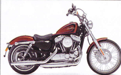
Die originale Sportster XL1200V Seventy-Two kam 2014 auf den Markt