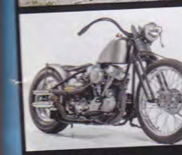
MC Sands Pan