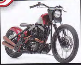
Perewitz Shovel Chop