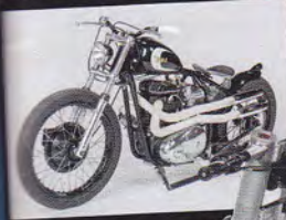
BSA Bobber Gaballier Sportster